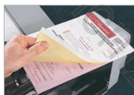
Marquage de liasses autocopiantes