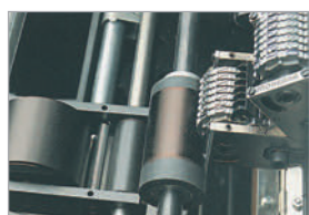
Système de numérotation rotatif